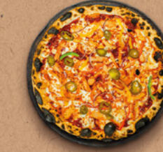
HOT SALSA Sauce salsa, mozzarella, poulet rôti, poivrons, piments jalapeños, oignons rouges.