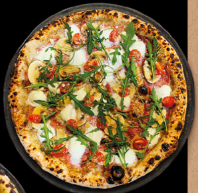
LA TRUFFE Crème de truffes, Jambon, champignons, mozzarella di bufala AOP, parmigiano reggiano AOP, tomates cerises, roquette.