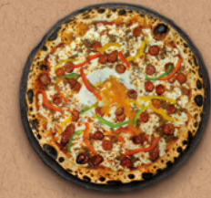
TEXACO Sauce tomate BIO, mozzarella, bœuf haché, merguez, poivrons, œuf.