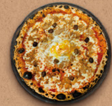
PÊCHEUR Sauce tomate BIO, mozzarella, thon, olives, œuf.