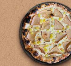
CHICKEN Crème fraîche, mozzarella, poulet fumé, pommes de terre.