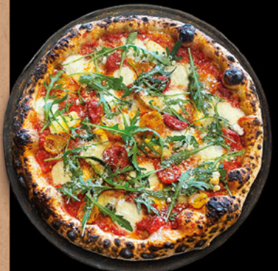
LA FORMAGGI Sauce tomate BIO, bûche de chèvre, gorgonzola AOP, mozzarella di bufala AOP, parmigiano reggiano AOP, tomates cerises, roquette.