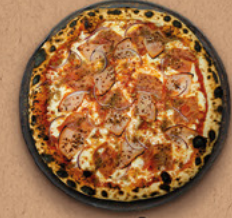
SUPRÊME Sauce tomate BIO, mozzarella, jambon, bacon, bœuf haché, oignons rouges.