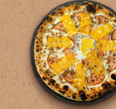
BAC'N'CHEDDAR Crème fraîche, mozzarella, cheddar fondu, bacon, bœuf haché, œuf.