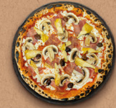
4 SAISONS Sauce tomate BIO, mozzarella, jambon, champignons, artichauts, olives.