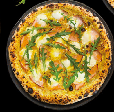
LA PISTAMIEL Sauce à la pistache, crème fraîche, mozzarella di bufala AOP, bacon, filet de miel BIO, roquette.