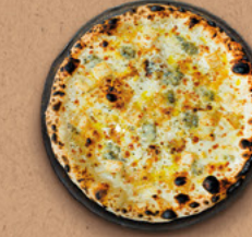
BLANCHEESE Crème fraîche, emmental râpé, bûche de chèvre, gorgonzola AOP, reblochon AOC, parmigiano reggiano AOP, filet d'huile d'olive BIO, origan.