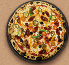
MESSICANO Sauce tomate BIO, mozzarella, pepperoni, tomates cerises, poivrons, piments jalapeños, olives.