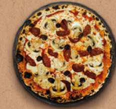
CHORIZO Sauce tomate BIO, mozzarella, champignons, chorizo, olives.