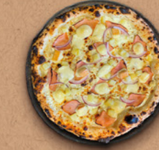
CHAMONIX Crème fraîche, mozzarella, bacon, pommes de terre, oignons rouges, fromage à raclette, reblochon AOC.