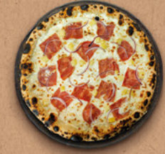
PAYSANNE Crème fraîche, mozzarella, jambon, pommes de terre, oignons rouges.