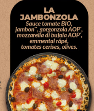
LA JAMBONZOLA Sauce tomate BIO, jambon, gorgonzola AOP, mozzarella di bufala AOP, emmental râpé, tomates cerises, olives.