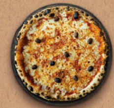
MARGHERITA Sauce tomate BIO, mozzarella, emmental râpé, olives, origan.