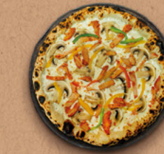
WEST COAST Crème fraîche, mozzarella, champignons, poulet rôti, poivrons.