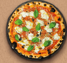
L'AUTHENTIC Sauce tomate BIO, mozzarella di bufala AOP, parmigiano reggiano AOP, filet d'huile d'olive BIO, origan.