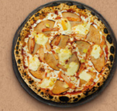
RACLETTE Sauce tomate BIO, mozzarella, poulet fumé, poulet rôti, pommes de terre, fromage à raclette.