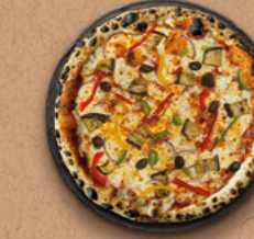
RATATOUILLE Sauce tomate BIO, mozzarella, aubergines grillées et marinées, poivrons, oignons rouges, tomates cerises, olives.