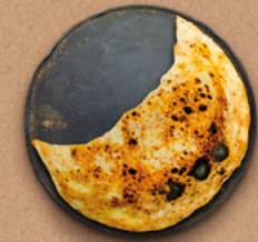
CALZONE Sauce tomate BIO, mozzarella, jambon ou bœuf haché, œuf.