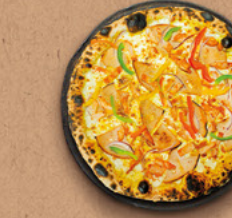
INDIENNE Crème fraîche, sauce indienne, mozzarella, poulet fumé, poulet rôti, poivrons, oignons rouges.