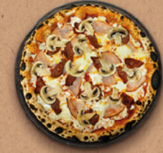
CHORIBLOCHON Sauce tomate BIO, mozzarella, bacon, chorizo, champignons, reblochon AOC.