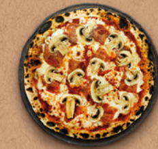
REINE Sauce tomate BIO, mozzarella, jambon, champignons.