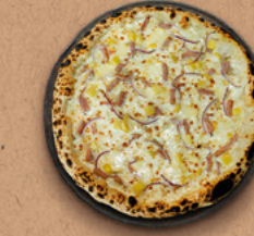
TARTIFLETTE Crème fraîche, mozzarella, lardons, pommes de terre, oignons rouges, reblochon AOC.