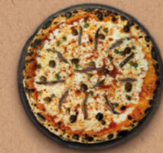
SICILIENNE Sauce tomate BIO, mozzarella, anchois à l'huile d'olive, câpres, olives.