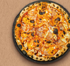
CHICK'N'BBQ Sauce barbecue, mozzarella, cheddar fondu, bacon, poulet rôti, oignons rouges.