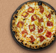
CHÈVROMIEL Crème fraîche, mozzarella, jambon, bûche de chèvre, filet de miel BIO.