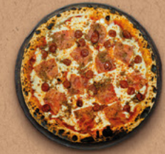
MEATIC Sauce tomate BIO, mozzarella, jambon, bœuf haché, merguez.