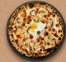
ORIENTALE Sauce tomate BIO, mozzarella, champignons, merguez, œuf.