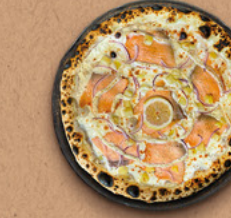
NORDIC Crème fraîche, mozzarella, saumon fumé, pommes de terre, oignons rouges, filet de fromage boursin, aneth, citron.