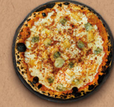
4 FROMAGES Sauce tomate BIO, mozzarella, emmental râpé, gorgonzola AOP, bûche de chèvre, origan.