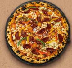
BUFFALO Sauce barbecue, mozzarella, bœuf haché, pepperoni, tomates cerises, poivrons.