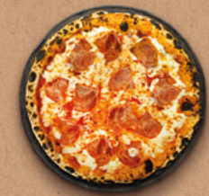
BAMBINO Sauce tomate BIO, mozzarella, jambon.