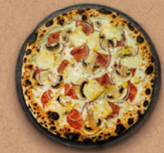
SAVOYARDE Crème fraîche, mozzarella, jambon, champignons, pommes de terre, oignons rouges, fromage à raclette.