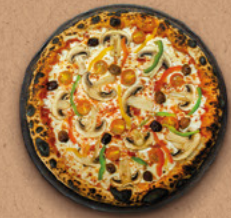
VÉGÉTARIENNE Sauce tomate BIO, mozzarella, champignons, tomates cerises, poivrons, olives.