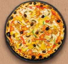
L'ARTICHAUT Sauce tomate BIO, mozzarella, champignons, thon, artichauts, tomates cerises, poivrons, oignons rouges, olives.