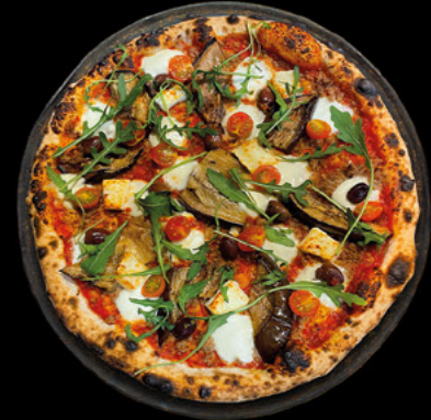
L'AUBERGINE Sauce tomate BIO, bœuf haché, bûche de chèvre, aubergines grillées et marinées, olives, mozzarella di bufala AOP, tomates cerises, roquette.