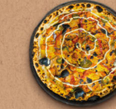
CHICK'NAAN Crème fraîche, sauce indienne, cheddar fondu, poulet rôti, poivrons, piments jalapeños, oignons rouges, tomates cerises, filet de fromage La Vache qui rit.