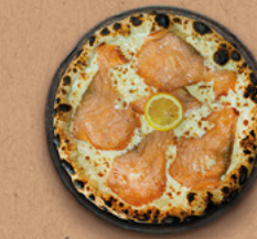
SAUMON Crème fraîche, mozzarella, saumon fumé, aneth, citron.